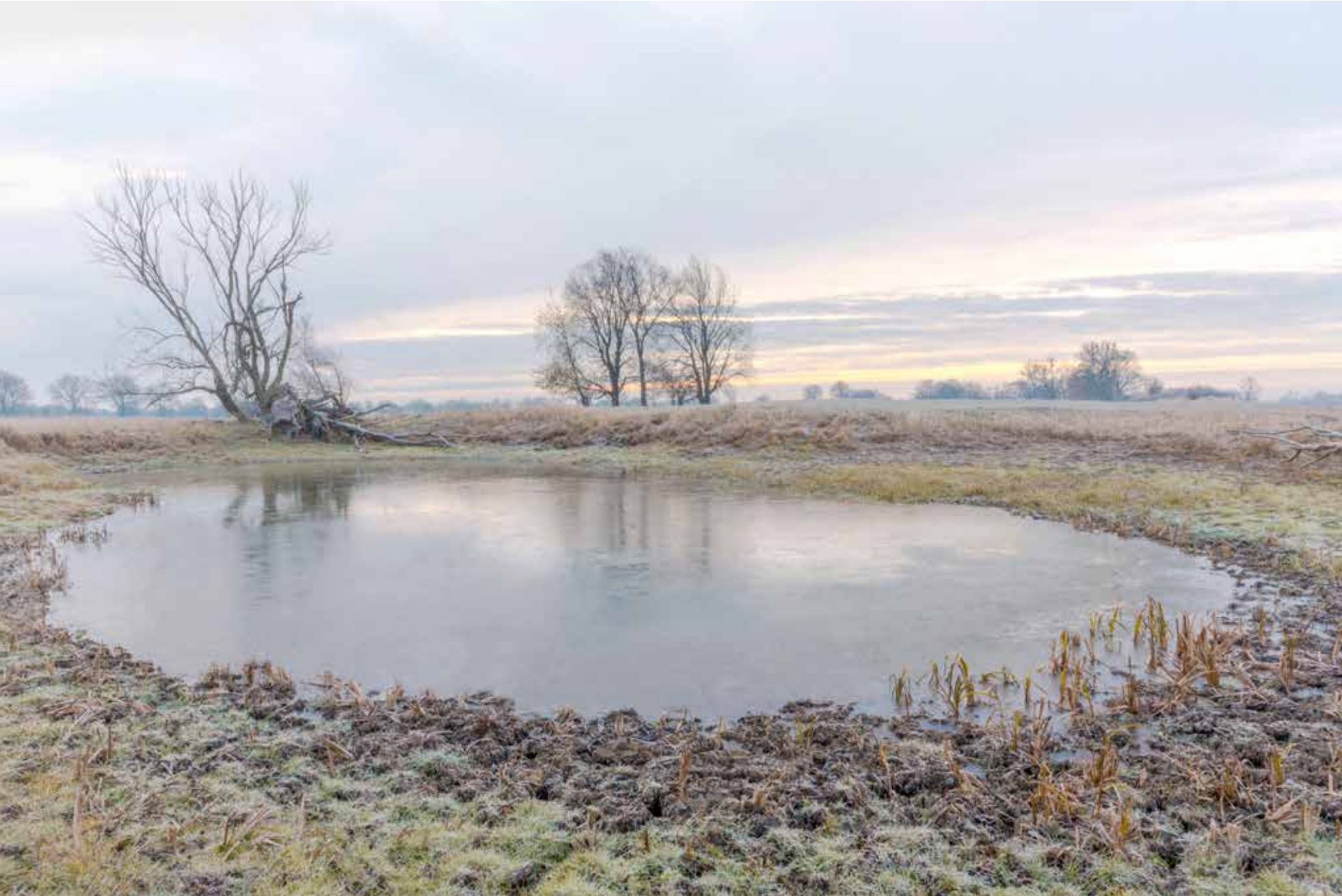
Bei Nieschen, Kalenziger Bunst

1 2 3 4 5 6 7 8 9 10 11 12 13 14 15 16 17 18 19 20 21 22 23 24 25 26 27 28 29 30 31 Fr Sa So Mo Di Mi Do Fr Sa So Mo Di Mi Do Fr Sa So Mo Di Mi Do Fr Sa So