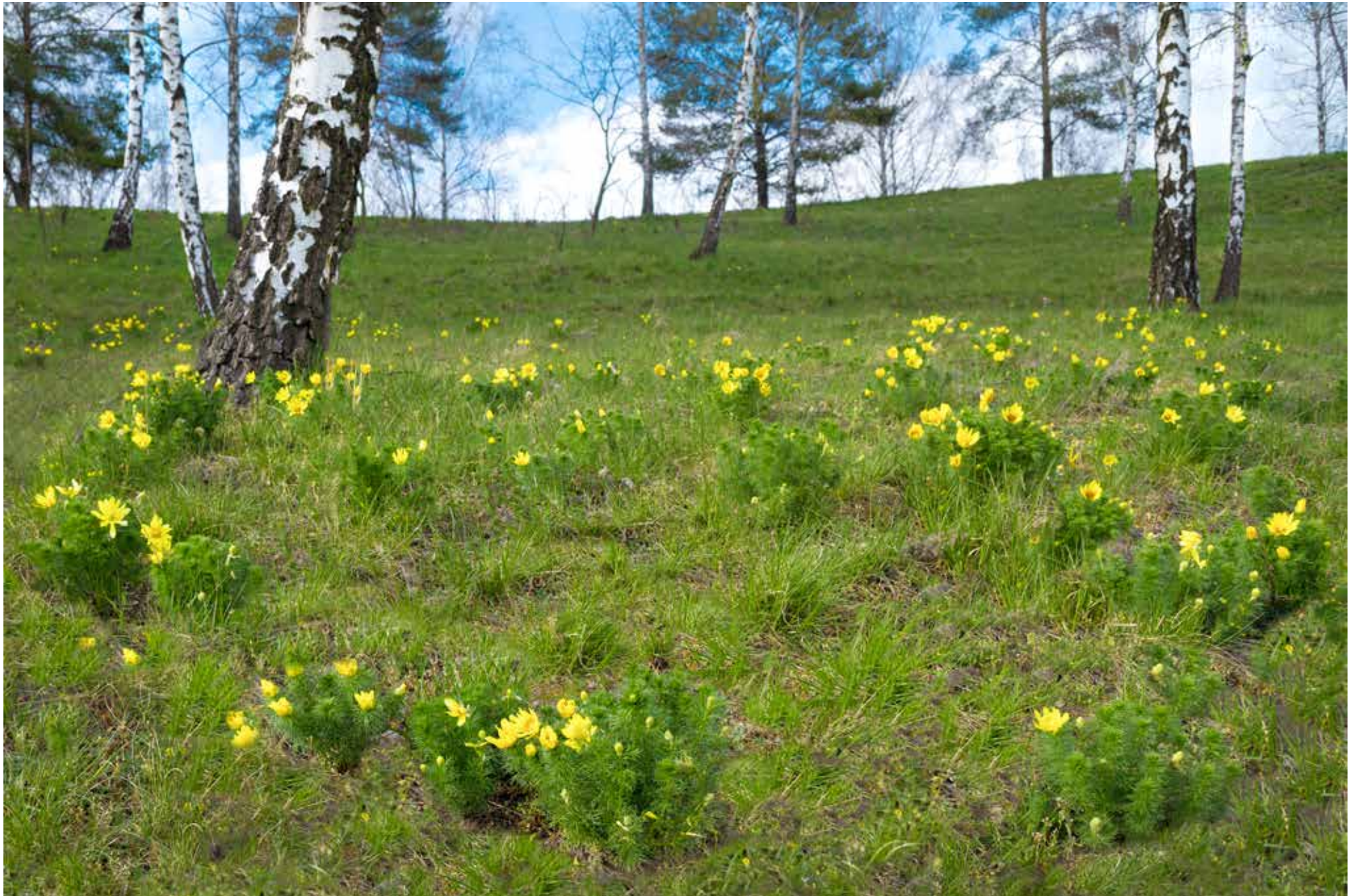
Zwischen Libbenichen und Mallnow

1 2 3 4 5 6 7 8 9 10 11 12 13 14 15 16 17 18 19 20 21 22 23 24 25 26 27 28 29 30 Do Fr Sa So Mo Di Mi Do Fr Sa So Mo Di Mi Do Fr Sa So Mo Di Mi Do Fr Sa So Mo Di Mi Do Fr