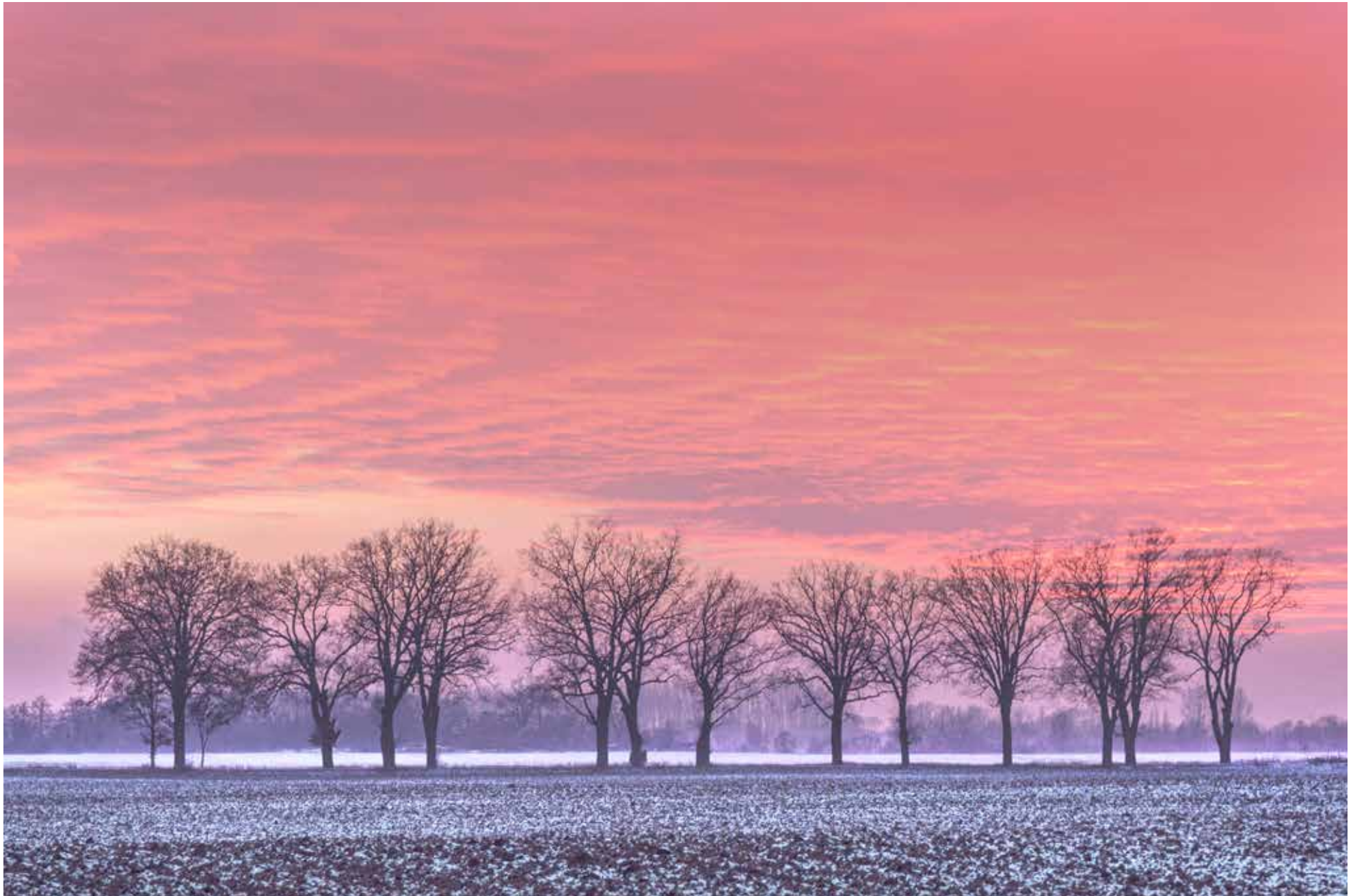
Allee bei Solikante

1 2 3 4 5 6 7 8 9 10 11 12 13 14 15 16 17 18 19 20 21 22 23 24 25 26 27 28 29 30 31 Mi Do Fr Sa So Mo Di Mi Do Fr Sa So Mo Di Mi Do Fr Sa So Mo Di Mi Do Fr Sa So Mo Di Mi Do Fr