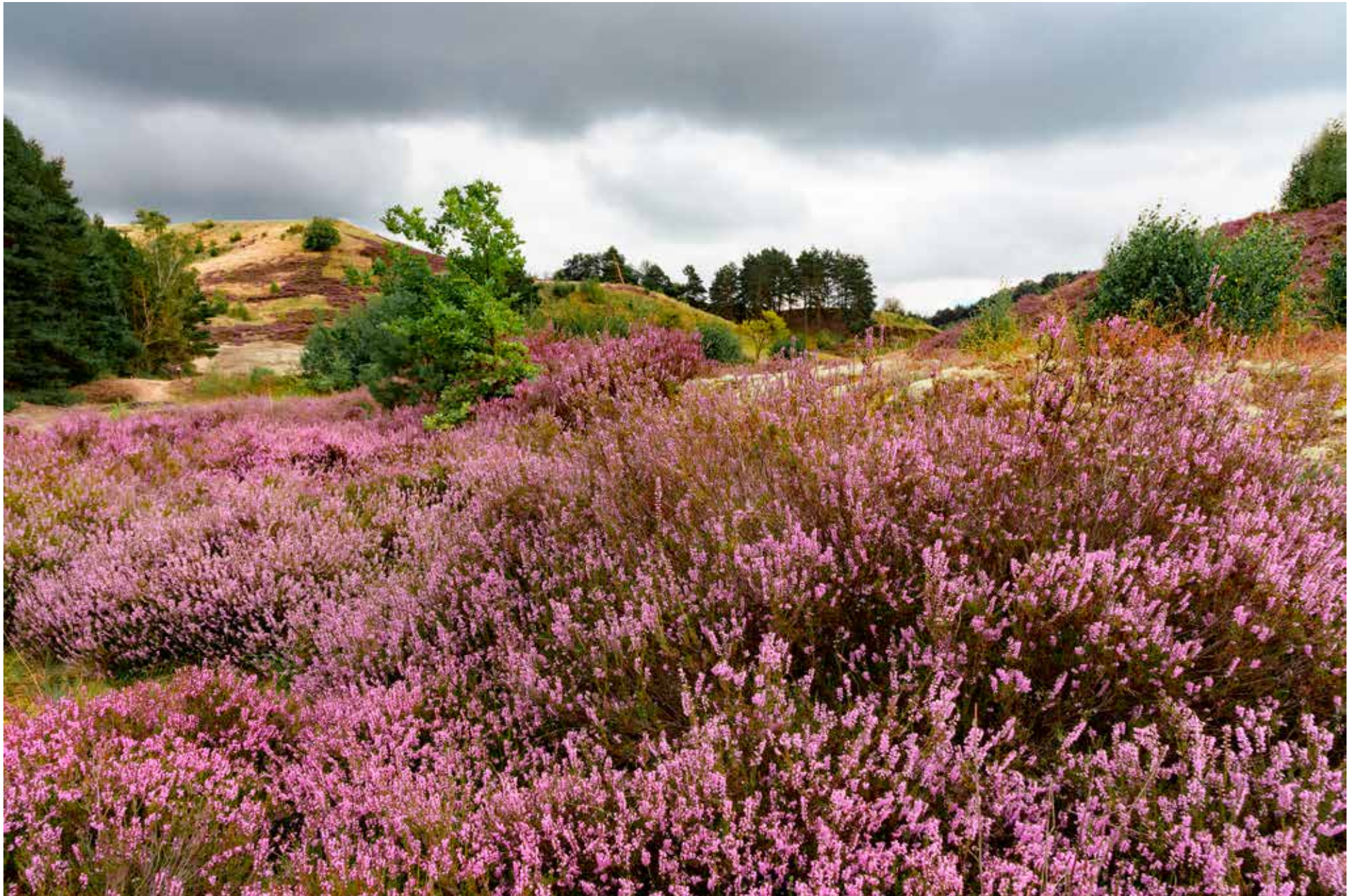
Neumärkische Höhe, bei Osinow Dolny

1 2 3 4 5 6 7 8 9 10 11 12 13 14 15 16 17 18 19 20 21 22 23 24 25 26 27 28 29 30 Mi Do Fr Sa So Mo Di Mi Do Fr Sa So Mo Di Mi Do Fr Sa So Mo Di Mi Do Fr Sa So Mo Di Mi Do