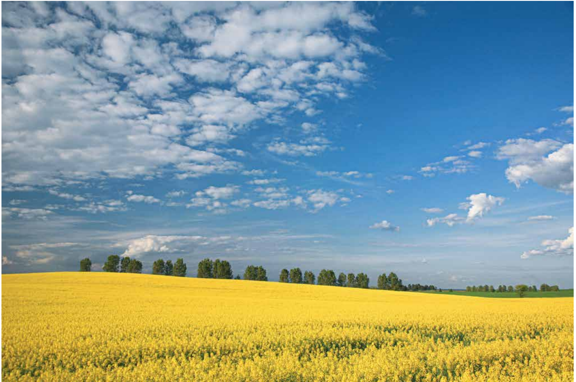
Wriezener Höhe, bei Schulzendorf

1 2 3 4 5 6 7 8 9 10 11 12 13 14 15 16 17 18 19 20 21 22 23 24 25 26 27 28 29 30 31 Sa So Mo Di Mi Do Fr Sa So Mo Di Mi Do Fr Sa So Mo Di Mi Do Fr Sa So Mo Di Mi Do Fr Sa So Mo